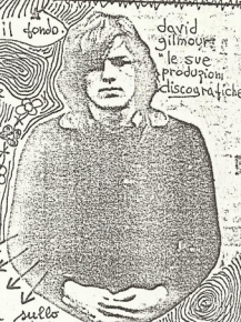
David Gilmour le sue produzioni discografiche

RECUMSEH Di questo brano non esiste la registrazione su disco. Esiste solo lo spartito musicale.